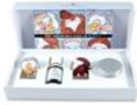
Les Parfumables & Mette Galatius